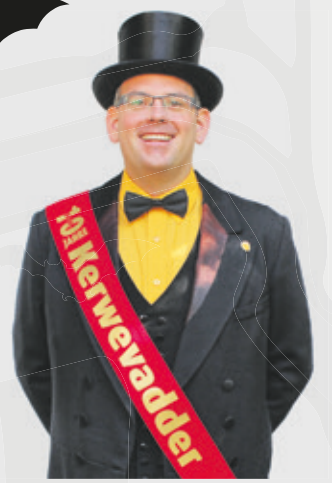
Herzliche Grüße und... ... „Wem ist die Kerb...UNSER!“